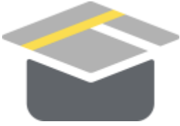
Abbildung 2. Das OpenSchoolMaps-Logo.